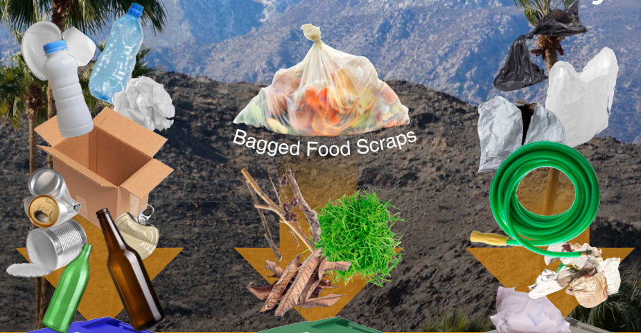
Bagged Food Scraps