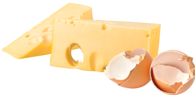
Dairy Products & Eggshells