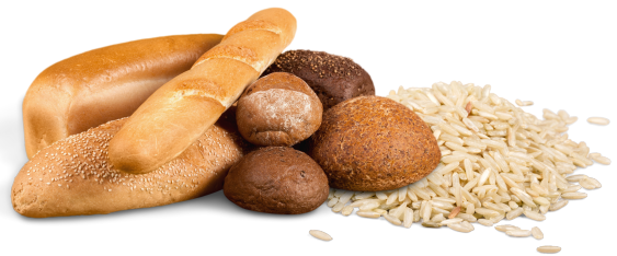
Pan, pasta y arroz