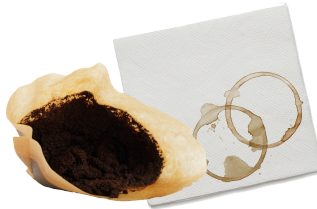
Food Soiled Paper