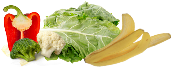
Frutas y verduras