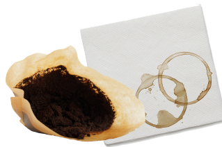
Papel contaminado con comida